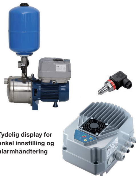
Tydlig display for enkel innstilling og alarmhåndtering

Pumpen passer både som hydrofor- og vanningspumpe da den tåler kontinuerlig drift. Pumpen er selvsugende (suger også luft), hvilket gjør igangsetningen lettere etter montering.